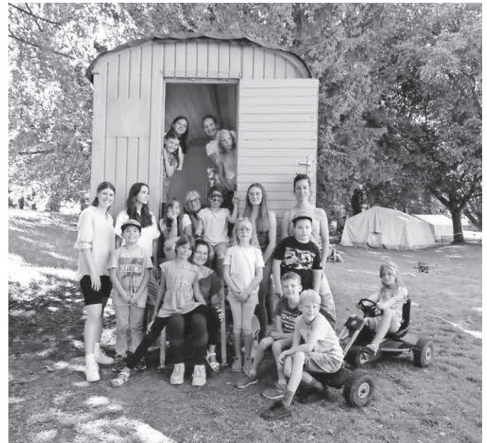
Ein tolles Team, Erfahrungen im Umgang mit Kindern und jede Menge Spaß: Das erwartet Ferienjobberinnen und -jobber bei der Ferienfreizeit in Hegenberg.

Die integrativen Ferienfreizeiten für Kinder im Alter von fünf bis zehn Jahren werden angeboten von der Stiftung Liebenau in einer Veranstaltergemeinschaft mit der Caritas Bodensee-Oberschwaben, dem Bildungszentrum St. Konrad, sowie dem Bund der Deutschen Katholischen Jugend (BDKJ, Dekanat Ravensburg) und der Gemeinde Meckenbeuren als Partner.