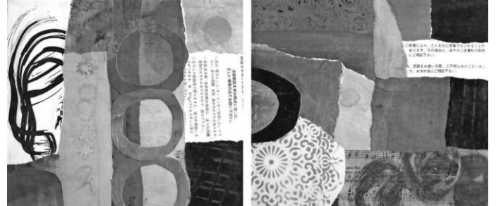
Dauer der Ausstellung 21. April - 2. Juni 2024

Ausdrucksstarke Collagen mit selbstbedrucktem Papier in Verbindung mit Acrylfarbe und Gemälde zeigen die absolute Liebe der Künstlerin zum Bunten, Farbigen, Kräftigen. „Eintauchen in Farbe, darin baden, einen Kopfsprung machen, lauthals jauchzend mitten hinein, mich dem Gelb, dem Blau, dem Rot... hingeben - ein absolutes Glück!“ www.sabine-essich.de Galerie geöffnet sonntag 14 - 18 Uhr und zu den Kulturveranstaltungen.