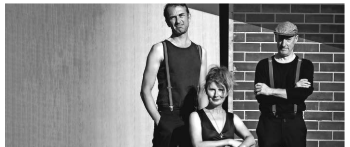
Kartenvorverkauf seit 8. April 17 € · AK 19 €