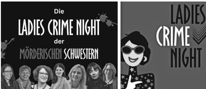
Kartenvorverkauf seit 4. Dezember 20 € · AK 22 €

Haben Sie schon von Krimis im 10-Minuten-Takt gehört? Von einem Event mit Herzklopfen und Schuss? Das ist die Ladies Crime Night der Mörderischen Schwestern. Bei der Ladies Crime Night tauchen fünf Autorinnen für jeweils zehn Minuten in die Welt des Verbrechens ein. Ist die Zeit abgelaufen, ertönt ein Schuss und schon betritt die nächste Autorin die Bühne. Musikalisch begleitet werden die Mörderischen Schwestern von Sally Grayson, die mit ihrer unverwechselbaren Stimme für zusätzliche Gänsehautmomente sorgt.