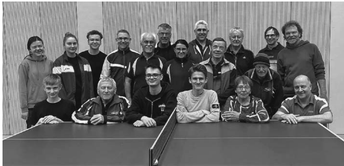
Teilnehmer Vereinsmeisterschaft Jugend und Aktive