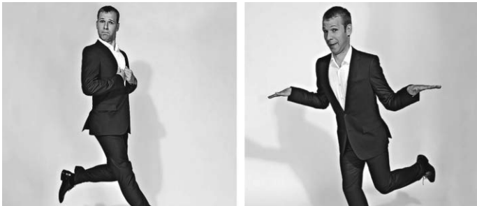
Kartenvorverkauf seit 4. Dezember 20 € · AK 22 €