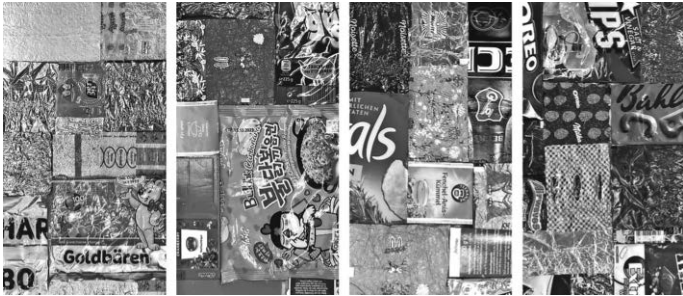
Dauer der Ausstellung 14. Januar - 18. Februar 2024

Auch auf direkten Anfragen beim Kulturverein Oberteuringen können Gruppen / Schulklassen die Ausstellung besuchen.