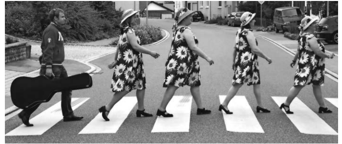
Kartenvorverkauf seit 4. Dezember 18 € · AK 20 €