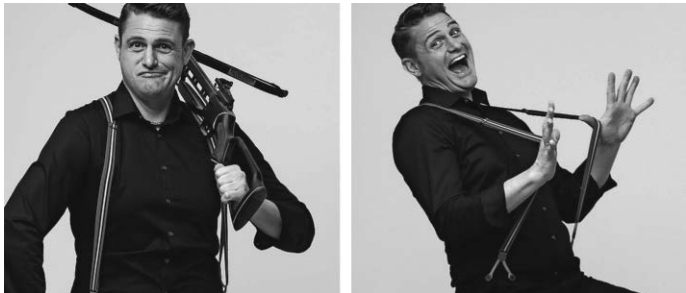
Karten-Vorverkauf seit 5. Februar 18 € · AK 20 €