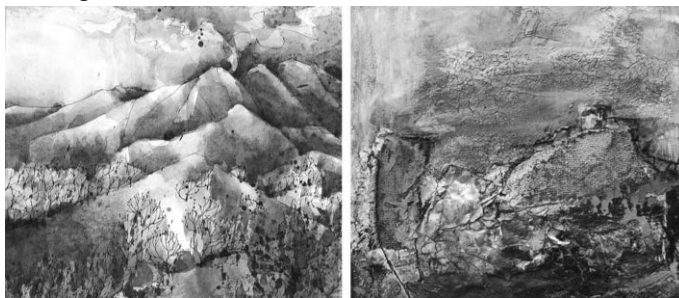
Dauer der Ausstellung 29. Oktober - 17. Dezember 2023

Galerie geöffnet sonntags 14 - 18 Uhr und zu den Kulturveranstaltungen