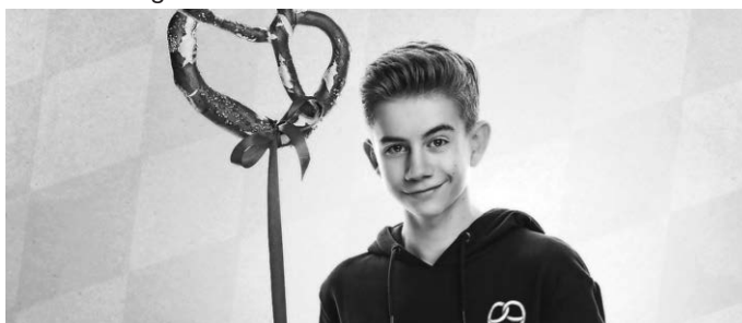
Kartenvorverkauf seit 25. September 12 € / 18 € · AK 12 € / 18 €

Karten ab 6 Jahre kosten 12 €, Karten ab 17 Jahre kosten 18 €. Veranstaltung ausverkauft!