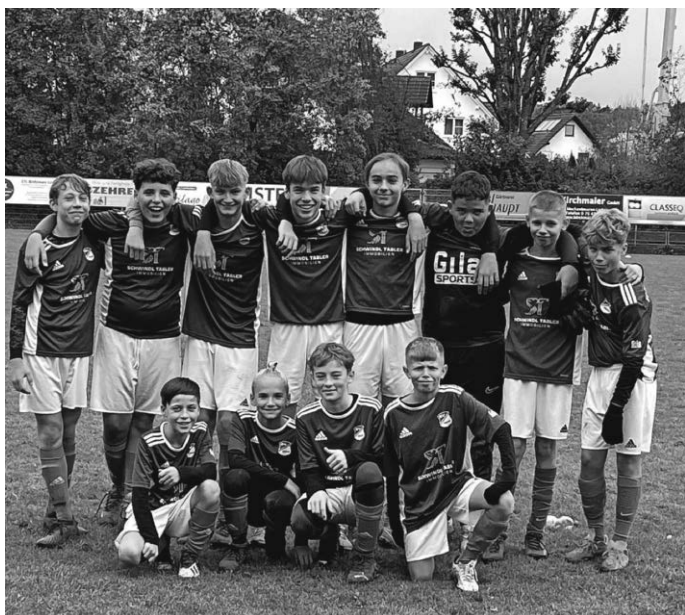
D Jugend nach dem Spiel in Brochenzell

Kommt am Samstag, 11.11. um 12:45 Uhr vorbei.