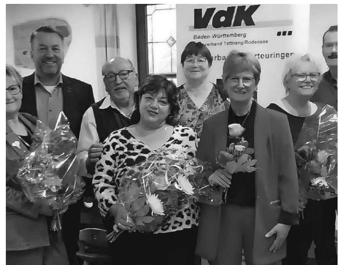
Das neue VdK Team.