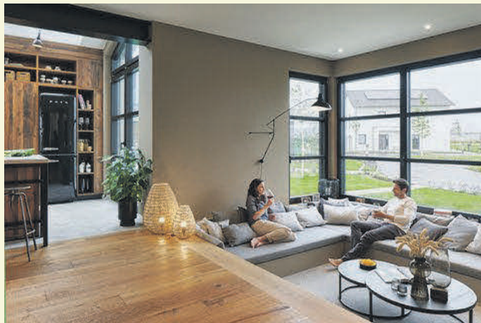
In seinem neuen Haus sollte man sich rundum wohlfühlen können.