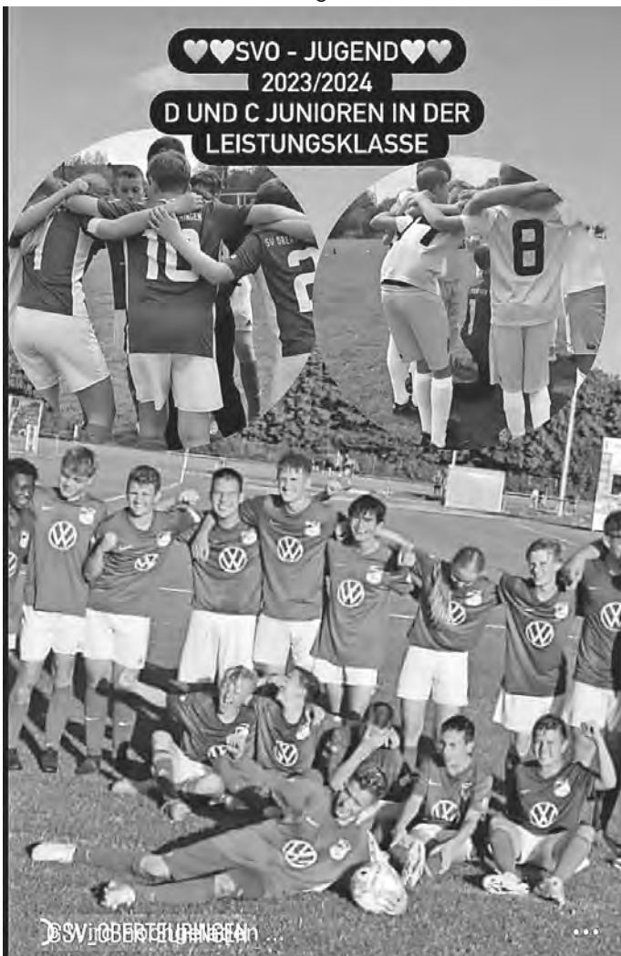
Unsere erfolgreichen C und D Junioren

Die C Jugend besiegte im Entscheidungsspiel am Freitag in Meckenbeuren die SG Baintd/Baienfurt II 2:1. Die D Jugend profitiert vom Rückzug des FV Langenargen bzw FC Friedrichshafen und darf sich ebenso auf die Leistungsstaffel freuen.