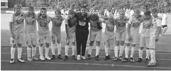
4. Platz in Salem für die D Junioren

Dennoch war das ein mega toller Fussballabend mit einem super 4. Platz.