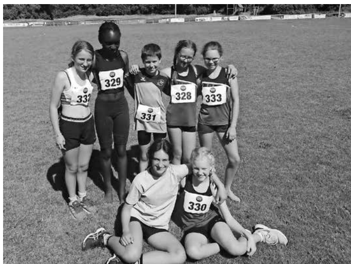
Die Mannschaft in Leutkirch

Die Abteilungsleitung gratuliert allen Teilnehmern zu diesen Erfolgen