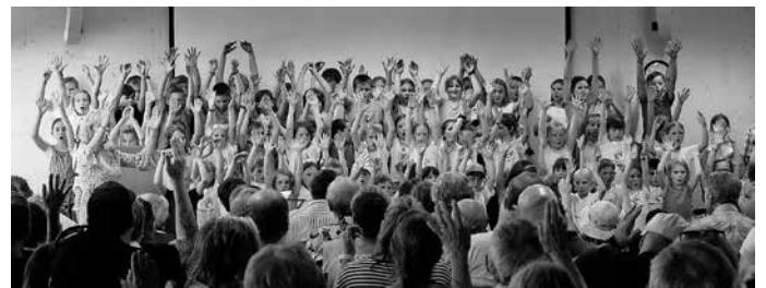
Der Schulchor verleiht der Einweihungsfeier einen gebührenden musikalischen Rahmen und sorgt für gute Stimmung.