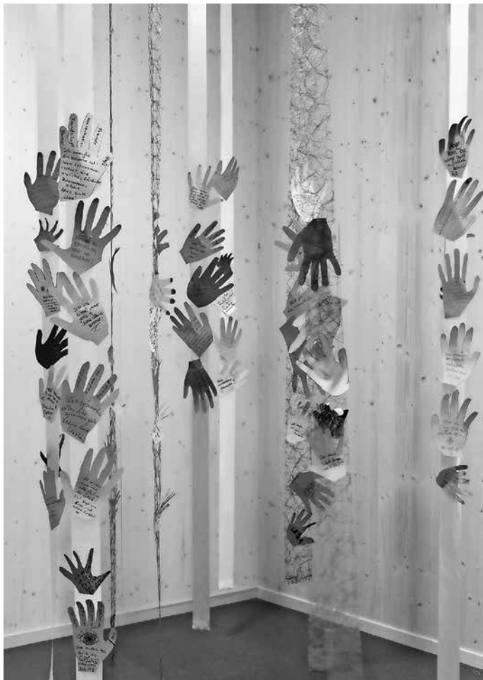
Wunschhände: Hier konnten alle Gäste ihre guten Wünsche für die Teuringer-Tal-Schule aufschreiben.