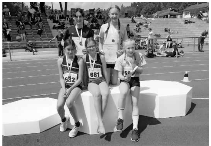
Die erfolgreiche Mannschaft