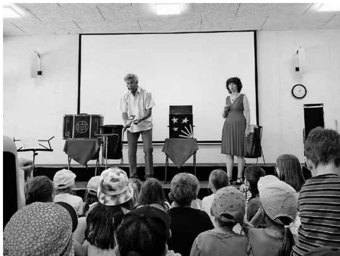
Auftritt des Künstlerpaars Duo Chicago

So verging der abwechslungsreiche Tag wie im Flug und alle großen und kleinen Besucher waren sich einig, dass mit dem Neubau alles richtig gemacht wurde und es den Kindern beim Lernen und im Ganztag an nichts fehlen wird.