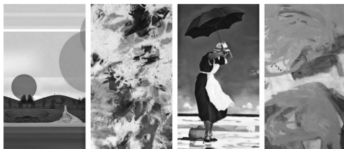
Dauer der Ausstellung 11. Juni - 23. Juli 2023

Galerie geöffnet sonntags 14 - 18 Uhr und zu den Kulturveranstaltungen