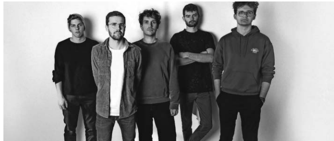
Kartenvorverkauf seit 17. April 15 € · 17 €

Pause ist mehrstimmiger Gesang und handgemachte Beats mit Gitarre, Saxophon, Schlagzeug, Bass und Synthesizer - harmonisch und frei, fetzig und heiß. Die fünf Musiker aus Markdorf kreieren eigene Klänge von Alternativ, Pop, Folk, kombiniert mit jazzigen Vibes – eine perfekte Sommernachts-Pause! https://pause-band.webflow.io