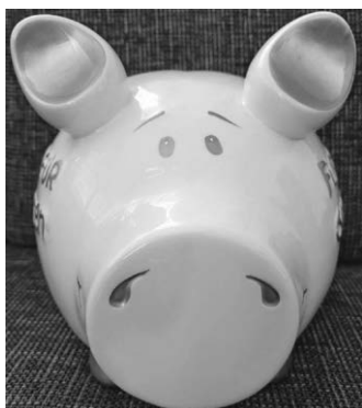
Fördi, unser immer hungriges Förderschwein

Haben Sie Fragen, Ideen oder möchten mithelfen, zögern Sie nicht, uns unter kontakt@foerdereverein-tts.de anzuschreiben oder uns anzusprechen.