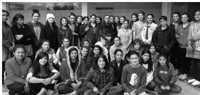
Im Herbst 2022 haben viele der Studentinnen den Abschluss gemacht und Neue sind wieder ins Wohnheim eingezogen.

Im Wohnheim sind nun 72 Mädchen und junge Frauen, davon sind 22 in der nahe gelegenen Karakorum Universität und 4 bekommen eine Ausbildung in einem Hotel. Den Besuch eines Colleges benutzen 46 und entscheiden sich bereits dort, was später studiert werden kann. Z.B. Medizin- Ingenieur-oder humanitäre Studien.