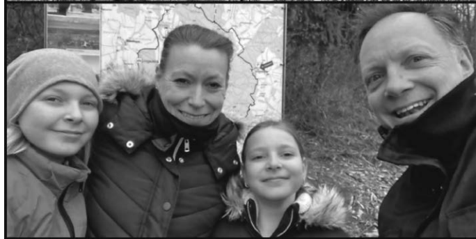
Vielen Dank allen fürs Mitmachen! Viele weitere Bilder von engagierten Sammler:innen finden Sie in der Collage im Fenster des Gemeinschaftsraums im Haus am Teuringer.