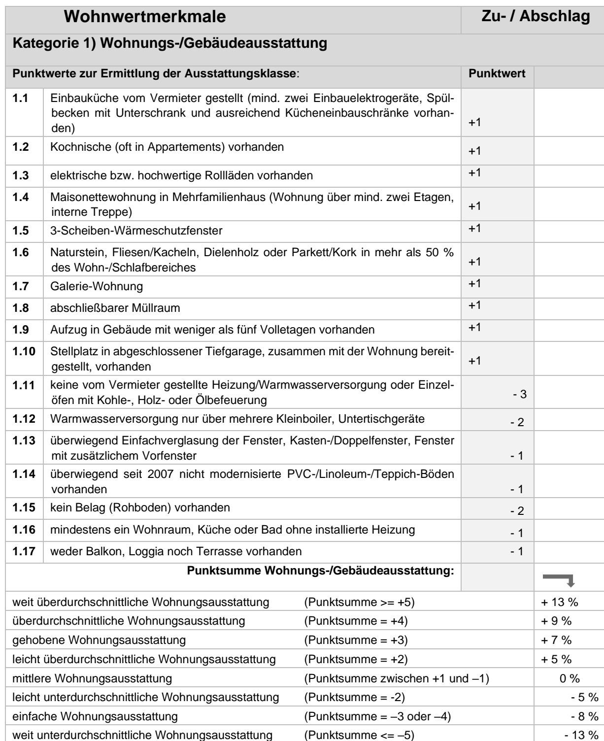
Tabelle 2: Weitere Wohnwertmerkmale, die den Mietpreis signifikant beeinflussen